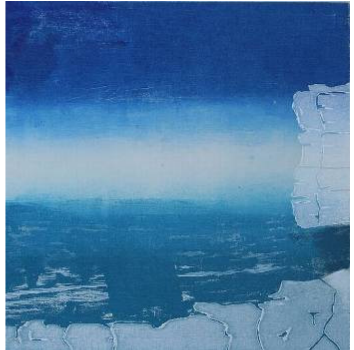
Renée Blom, Expositie "Ledenexpositie 9"